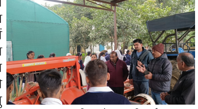
उन्नत कृषि यंत्रों पर परिचर्चा