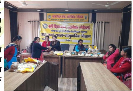
मूल्यवर्धित उत्पादों का प्रदर्शन