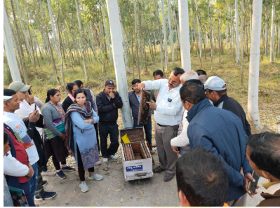
मधुमक्खी पालन प्रशिक्षण का आयोजन

प्रशिक्षण के मुख्य विषय बाजार आधारित प्रसार, ग्रामीण युवाओं हेतु स्वरोजगारपरक कुटीर उद्योग, मौन पालन: स्वरोजगार का अतिरिक्त माध्यम, उन्नत मत्स्य पालन तकनीक एवं उन्नत बकरी पालन सम्बन्धी