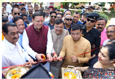
किसान मेले का उद्घाटन करते मा0 मुख्यमंत्री

मा. मुख्यमंत्री उत्तराखण्ड, श्री पुष्कर सिंह धामी ने कहा कि विकसित कृषि तकनीक के हस्तांतरण द्वारा समाज के अंतिम पायदान पर बैठे कृषकों को आत्मनिर्भर बनाया जा सकता है। आपने यह भी कहा कि पंत विश्वविद्यालय अपने शोध एवं प्रसार से अनेक