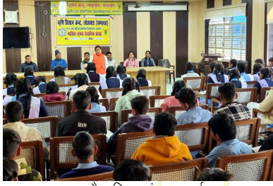
कृषक वैज्ञानिक संवाद कार्यक्रम