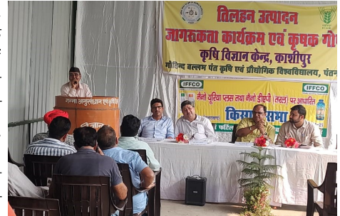
तिलहन उत्पादन जागरूकता कार्यक्रम