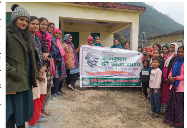
स्वच्छता अभियान का आयोजन

• परीक्षणों के अन्तर्गत गेहूं व सब्जी मटर के प्रजातीय परीक्षण, जैव उर्वरकों का गेहूं व जौ में प्रयोग, सोयाबीन टोफू पनीर का ग्रामीण क्षेत्रों तक पहुंच, सीडलिंग ट्रांसप्लान्टर के प्रयोग से महिलाओं के कार्यक्षमता में वृद्धि, पशुओं में स्वास्थ्य सुधार जैसे परीक्षण आयोजित किये गये हैं।