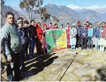
जनपद स्तरीय कृषक प्रशिक्षण/गोष्ठी का आयोजन

सुनोवाइट, मेघा, गिरिजा, प्याज-वी.एल.प्याज 3 व एन.एच.आर.डी. एफ रेड, लहसुन-एग्रोफाउण्ड पार्वती, राई-भरसार केदार राई तथा वी.एल. राई, मूली-स्कारलेट ग्लोब, गेहूँ वी.एल. 953, यू.पी.2903, यू.पी. 2855, यू.पी. 2865, मसूर पी.एल. 8, पी.एल. 9 प्रजातियों को प्रदर्शन के अन्तर्गत लगाया गया है।