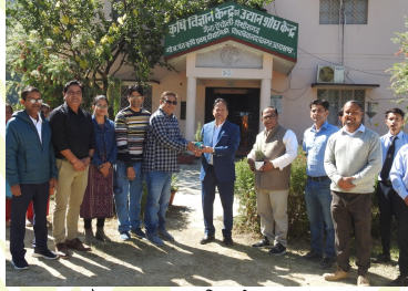
केन्द्र पर कुलपति जी का भ्रमण