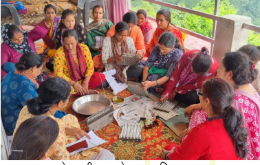
मोमबत्ती बनाने का प्रशिक्षण