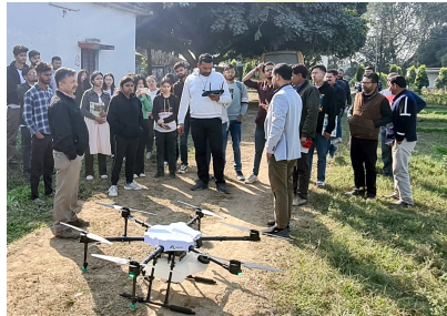
ड्रोन से रसायन छिड़काव का प्रदर्शन